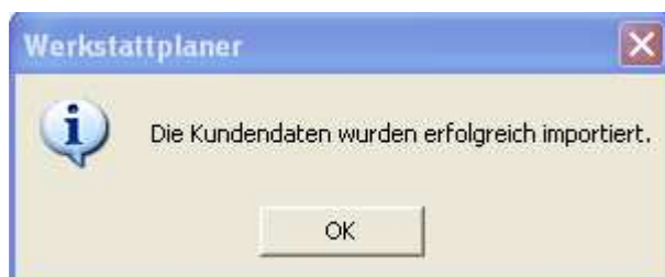
Abb.1.5 Der Datenimport ist nun abgeschlossen und Sie können die aus AutoData bereit gestellten Daten im Werkstattplaner nutzen.