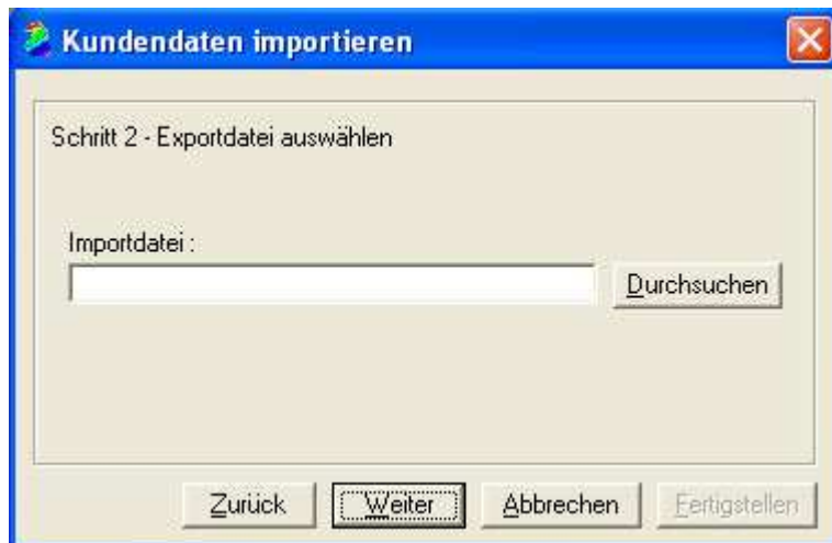
Abb.1.2 Wählen Sie hier über „Durchsuchen“ die in AutoData erstellte Exportdatei aus.

Nachname, Vorname, Modell, km-Stand, Amtl Kennzeichen, Telefon privat, Fahrgestellnr, HU-Termin, AU-Termin, Datum le# Wartung, Datum le# Auftrag, _berpr#fungsaktionen, Strasse, PLZ Ort, Kundennr, NoName