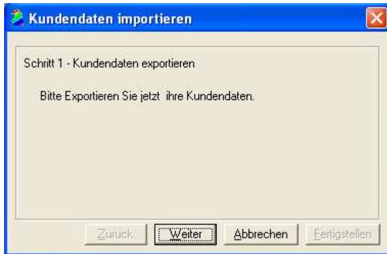
Abb.1.1 Klicken Sie auf „weiter“ nach erfolgtem Datenexport aus AutoData um zum nächsten Menü zu gelangen.