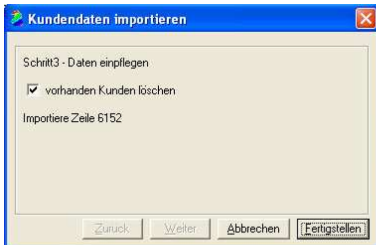
Abb.1.4 Die Daten werden nun in den Werkstattplaner importiert.