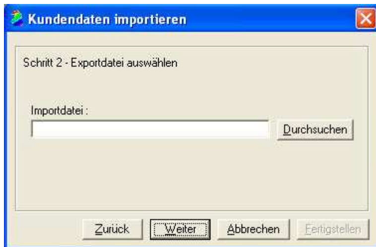
Abb.1.2 Wählen Sie hier über „Durchsuchen“ die in Autoline erstellte Exportdatei aus.

Kennz., Typ, Kunden-Nr., Name, Vorname, Strasse, PLZ, Ort, Tel.Privat, Handy, Fahrgestellnr.