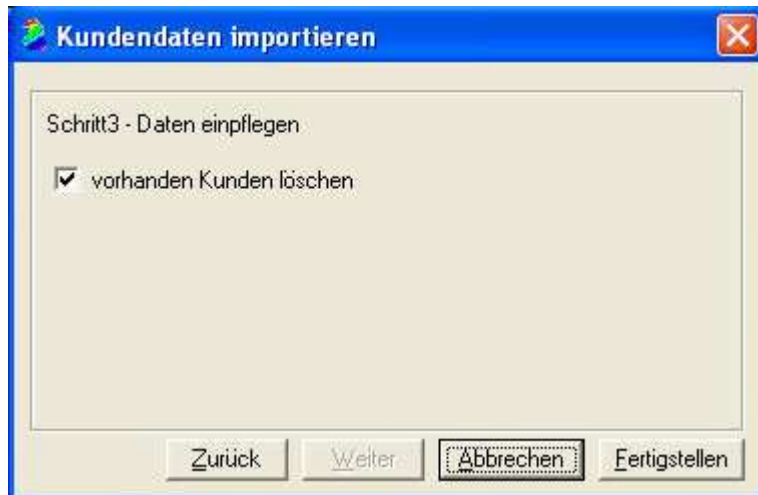
Abb.1.3 Durch „Fertigstellen“ wird nun der Datenimport gestartet.