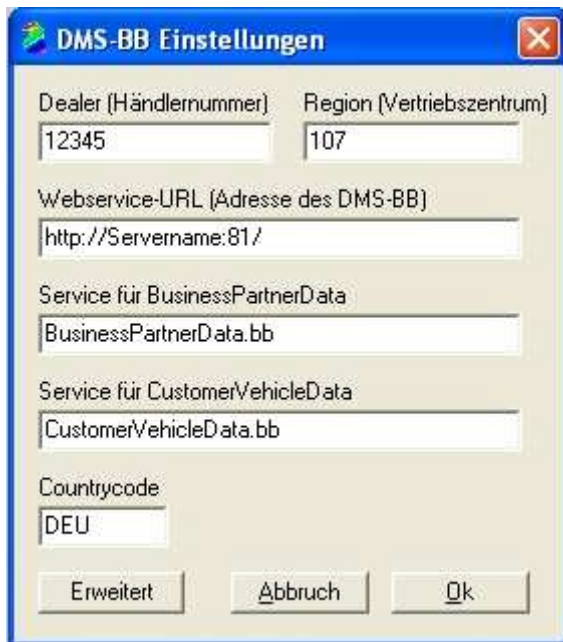
Abb.1.3 Im Feld Webservice-URL ersetzen Sie bitte das "Servername" durch den Namen Ihres Servers oder dessen IP-Adresse (bsp. http://192.168.10.100:81 oder http://MyServer:81).