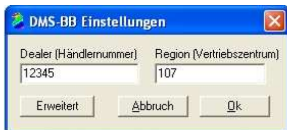
Abb. 1.2 Bitte tragen sie im Feld Dealer die mittleren 5 Ziffern Ihrer Händlernummer ein. Im Feld Region tragen Sie bitte die Nummer des Vertriebszentrums (bsp. 107) ein. Über den Button „Erweitert“ gelangen Sie in das nächste Menü (Abb 1.3)