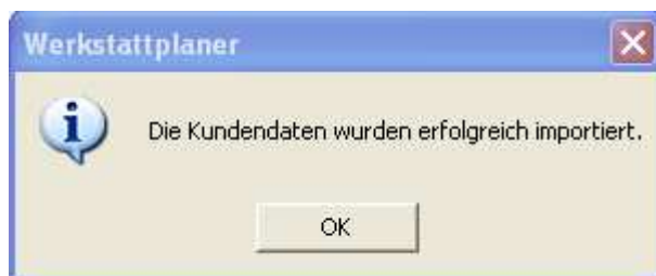
Abb.1.5 Der Datenimport ist nun abgeschlossen und Sie können die aus Formel1 bereitgestellten Daten im Werkstattplaner nutzen.