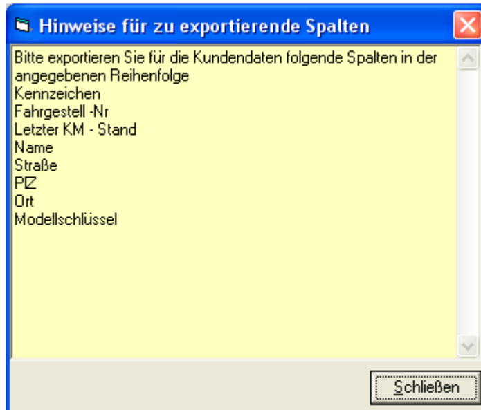
Abb.1.2 Bitte beachten Sie den Hinweis für die aus Midata zu exportierenden Spalten.