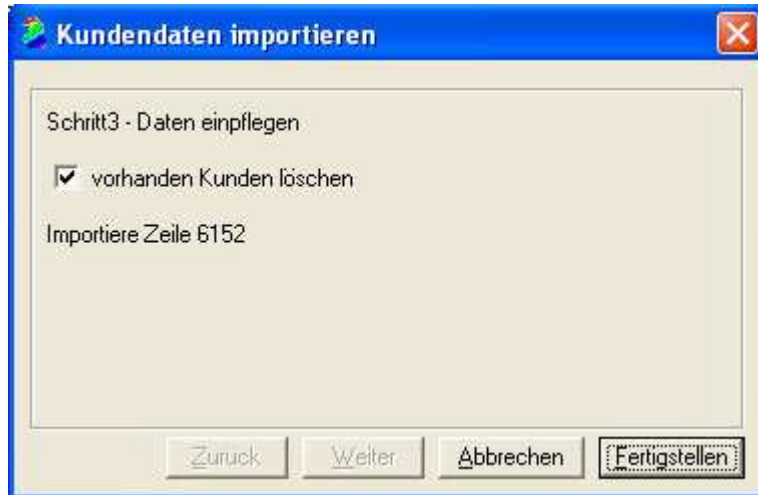
Abb.1.5 Die Daten werden nun in den Werkstattplaner importiert.