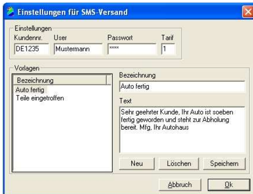
Abb. 1.4. Bitte geben Sie hier die Zugangsdaten Ihres Providers ein. Weiterhin können Sie SMS-Vorlagen erstellen und verwalten. Die Länge der Texte ist auf 255 Zeichen beschränkt.