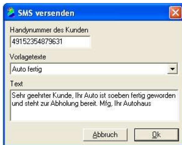
Abb. 1.2. Sollte die Handynummer Ihres Kunden über Ihr DMS gepflegt werden, wird diese automatisch übernommen (nur bei Werkstattplanern mit Schnittstelle). Ansonsten können Sie diese auch manuell eingeben. Vorlagen können nun selbst erstellt und der Text eingefügt werden. Bestätigen Sie anschließend den Versand der SMS durch Klick auf den Button "OK".