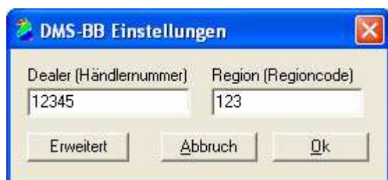
Abb. 1.2 Geben Sie hier Ihre Händlernummer und den Regioncode (für das Vertriebszentrum) ein.